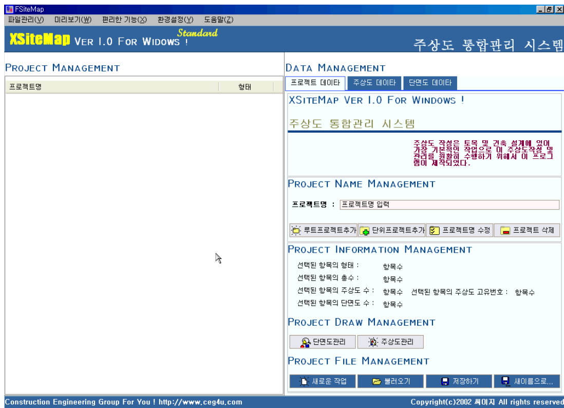
[그림] XSiteMap 초기 실행 화면

[참고] 로그인시 해당 컴퓨터는 인터넷이 연결되어 있는 상태이어야 합니다.